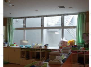
ビル内保育園の開口部。上部の排煙窓を換気にも利用しやすいよう改修した。

セミナーでは、横浜市のビル内保育施設で取り組んだ空気環境改善のための開口部の改修事例を紹介いたします。そして排煙窓に関する課題も含め、良好な空気環境の保育施設づくりや改修についてディスカッションを交え考えます。